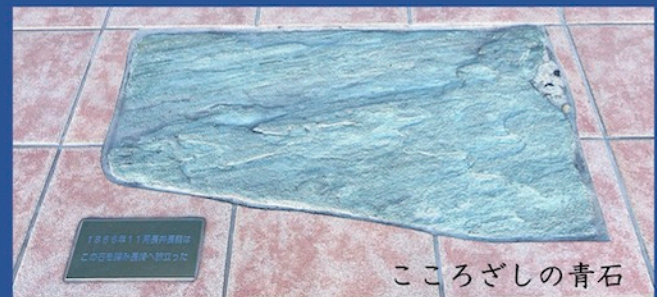
こころざしの青石